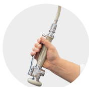
EROGATORE ACQUA COMPLETO (RISCIACQUO/SANIFICAZIONE) COMPLETEWATER DISPENSER (RINSING/SANITISING)