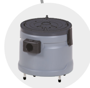
BIDONE DI FILTRAGGIO ACQUA ASPIRATA SUCTIONED WATER FILTRATION BIN