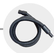
KIT TUBO E BOCCETTA PHON HOSE AND NOZZLE KIT FOR HOT AIR DRYER