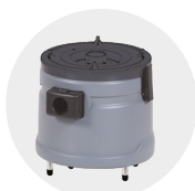
BIDONE DI FILTRAGGIO SCARICO ACQUA (SOLO CON VASCA) WASTE WATER FILTRATION BIN