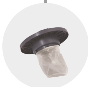
FILTRO NYLON BIDONI NYLON BIN FILTER