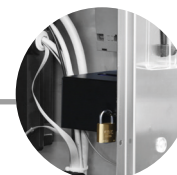
CASSETTO GETTONIERA LUCCHETTABILE LOCKABLE COIN COMPARTMENT (a richiesta/on demand)