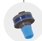
FILTRO SPUGNA ASPIRATORE SPONGE VACUUM FILTER