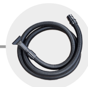
KIT TUBO E BOCCETTA ASPIRAZIONE HOSE AND NOZZLE FOR SUCTION KIT