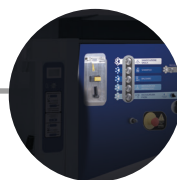
KIT ILLUMINAZIONE LED LED LIGHT KIT (a richiesta/on demand)