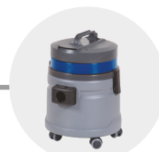
ASPIRATORE VACUUM CLEANER